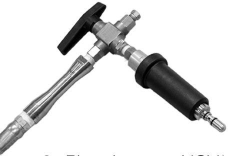
2x Pico de carga NGV1 con adaptador NZ